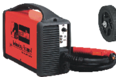
Technology 41 + 4 m hořáku