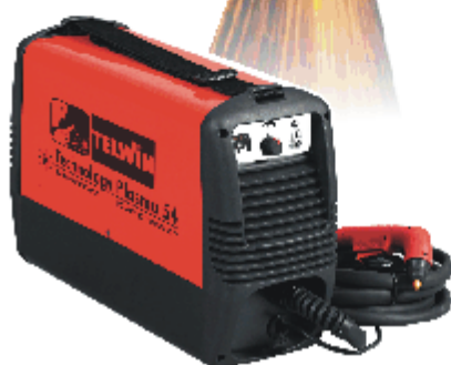
Technology 54 K s kompresorem + 4 m hořáku