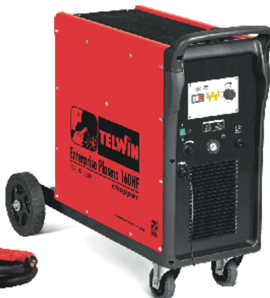
Enterprise 160 HF