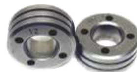
30 / 14 mm Telwin 4 kl. podava