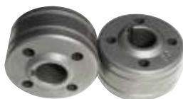
30 / 10 mm Telwin 2 kl. podava